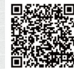
LIXILの紹介動画はコチラ

住まいStudio OSAKA LIXILショールーム南港 大阪市住之江区南港北1-7-62 休館日 毎週水曜日(祝日の場合は営業) ・夏期・年末年始